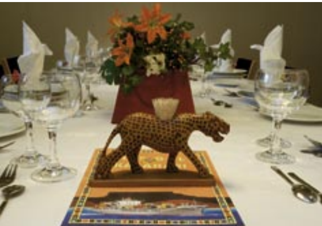
Abendessen / Dinner

Nur noch wenige Handelsschiffe nehmen Passagiere mit – dazu gehört die DAL KALAHARI. Seereisen auf einem echten Frachter sind Abenteuer, Erholung, Entdeckung. Der Passagier erlebt moderne Seefahrt pur. Kurze Hafenaufenthalte, intensiver Verladebetrieb, unvergessliche Strecken auf See. Ein Schiff und seine Mannschaft. 24 Stunden, drei Wachen – und Zeit für sich selbst.