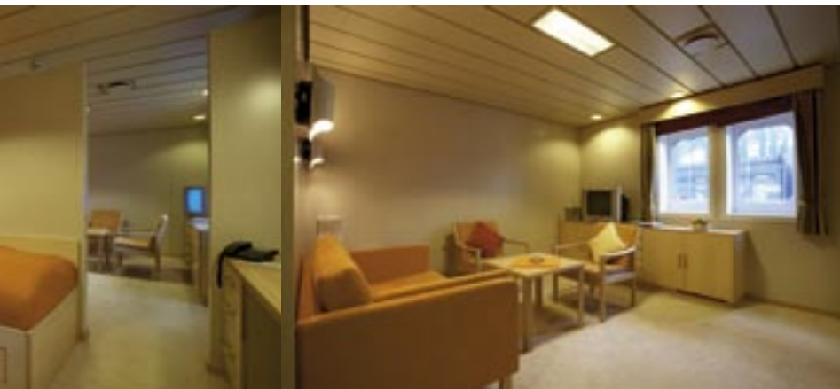
/ Suite bed room

Very few cargo ships still carry passengers, and the DAL KALAHARI is one of them. A voyage on a container ship is an adventure. Its relaxing – and is a voyage of discovery. The passenger experiences true life at sea. Short port calls, intensive cargo operations. Unforgettable passages across sea. A ship and its crew. Three eight hour watches. Time for oneself.