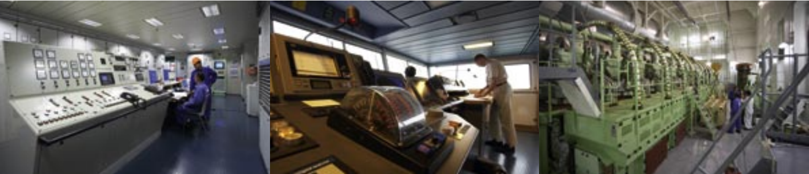
Auf See ist die Brücke (Mitte) für Passagiere zugänglich, während der Maschinenraum (links, rechts) nach Absprache zu besuchen ist. The

DEUTSCHE AFRIKA-LINIEN JOHN T. ESSBERGER