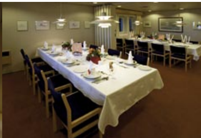
Messe / mess

The DAL KALAHARI, commissioned 2005 is a 63 000 tdw / 4 000 teu container vessel with a 265 meter length and 37 meter beam. Her 45 769 KW / 62 245 HP main engine enables 25 knot speeds.