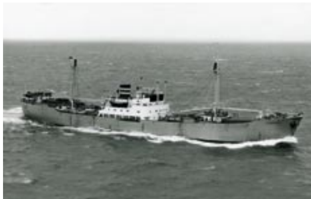
Im Vergleich zur DAL KALAHARI ist die TRANSVAAL von 1951 winzig. The TRANSVAAL, built 1951, is tiny in comparison to DAL KALAHARI.