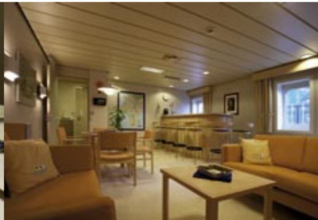
Bar / Salon / saloon